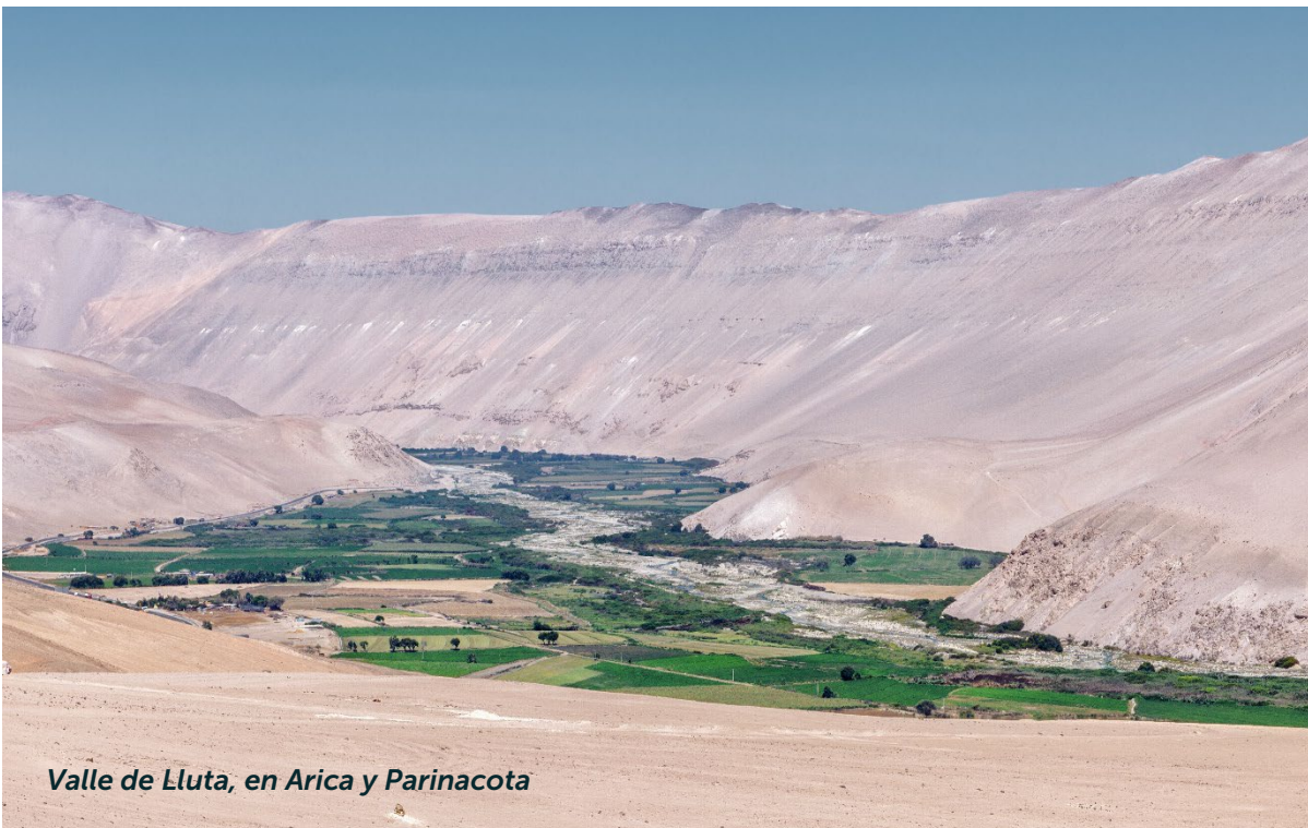
Valle de Lluta, en Arica y Parinacota

La región de Arica y Parinacota podrá diferenciarse en el mercado europeo y atraer a consumidores que valoran la autenticidad y la tradición. Las indicaciones geográficas son, en este sentido, parte de la herencia y patrimonio cultural, histórico y económico de los pueblos, y el reconocimiento de esta herencia, vinculada cercanamente a pueblos originarios y comunidades locales, podrá ser un gran impulso para la internacionalización del Orégano de la Precordillera de Putre , el Maíz Lluteño y las Aceitunas de Azapa , todos ellos cultivados con técnicas ancestrales en condiciones geográficas excepcionales y únicas en el mundo.