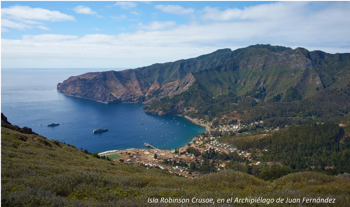
Isla Robinson Crusoe, en el Archipiélago de Juan Fernández

Esta protección es un beneficio para las emprendedoras y emprendedores de Valparaíso tanto en su territorio insular y continental, los que contarán con el reconocimiento de su indicación geográfica por parte de la UE, pudiendo diferenciarse frente a otros orígenes agregando valor a su oferta y contando con protección contra la imitación y la competencia, construyendo una marca de identidad más allá de las fronteras de Chile.