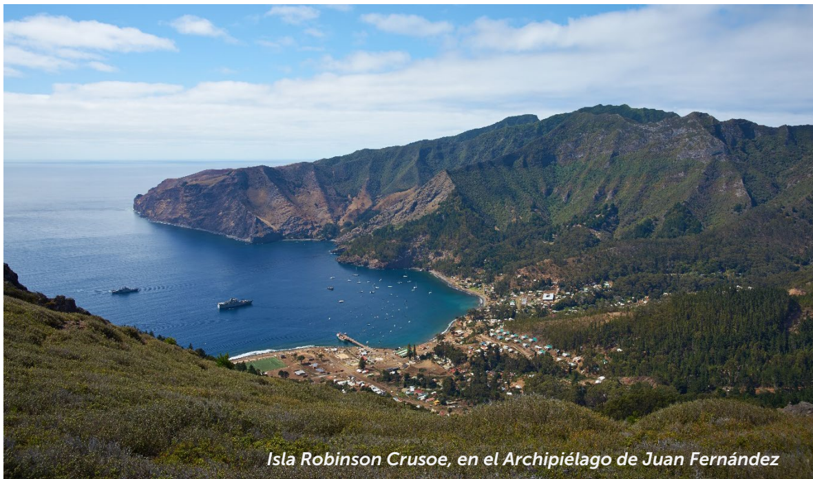
Isla Robinson Crusoe, en el Archipiélago de Juan Fernández

Esta protección es un beneficio para las emprendedoras y emprendedores de Valparaíso tanto en su territorio insular y continental, los que contarán con el reconocimiento de su indicación geográfica por parte de la UE, pudiendo diferenciarse frente a otros orígenes agregando valor a su oferta y contando con protección contra la imitación y la competencia, construyendo una marca de identidad más allá de las fronteras de Chile.