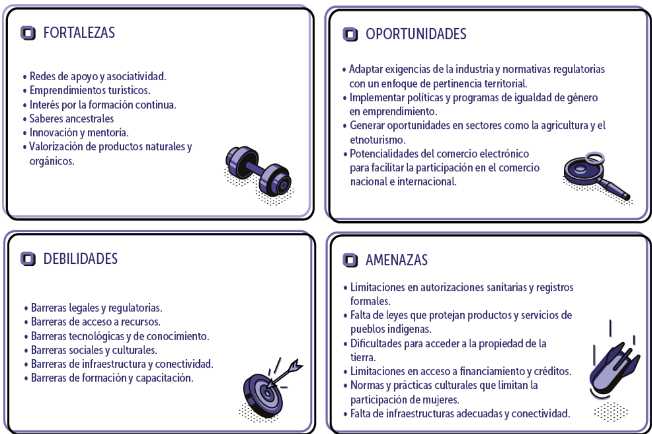
Figura 7. Resumen de las características del emprendimiento femenino rural en países de la Alianza del Pacífico.

Esas políticas son necesarias. Yo creo que es necesario subvencionar, apoyar en un primer momento para que haya espacios de comercialización en los respectivos mercados. (Informante 7_10.05).