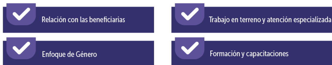
Figura 5. Buenas prácticas y aprendizajes destacables

Finalmente, cada uno de los puntos mencionados de manera previa permiten avanzar hacia procesos de fortalecimiento del empoderamiento femenino y especialmente, hacia su autonomía económica, a través de la revalorización de su rol como mujeres empresarias y su aporte en las actividades económicas y productivas de sus territorios.