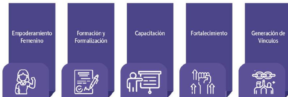
Figura 1. Principales ejes de trabajo de instituciones participantes

En general, los cinco principales pilares de trabajo que se han observado por medio de lo manifestado en las entrevistas son: i) empoderamiento de las mujeres emprendedoras, ii) la formación y formalización de emprendimientos, iii) la capacitación, iv) el fortalecimiento de emprendimientos pequeños y medianos y v) la generación de vínculos tanto dentro de los mismos emprendimientos, como también con alianzas que permitan la comercialización internacional. Estos pilares se van desarrollando en una especie de hoja de ruta que permite acompañar a las mujeres en cada una de las etapas de desarrollo de sus emprendimientos.